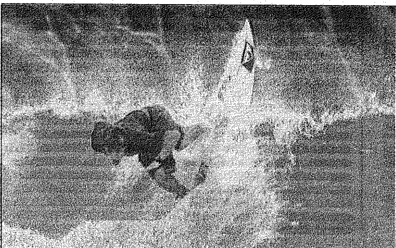
Aranburu El zarautztarra, en una imagen de archivo del circuito mundial WQS

El mejor golfista español de la historia está siguiendo en su domicilio de Pedreña (Cantabria) su recuperación de las intervenciones en el tumor cerebral que sufrió el pasado mes de octubre. El ex golfista difundió el proceso de su rehabilitación a través de su página web ●