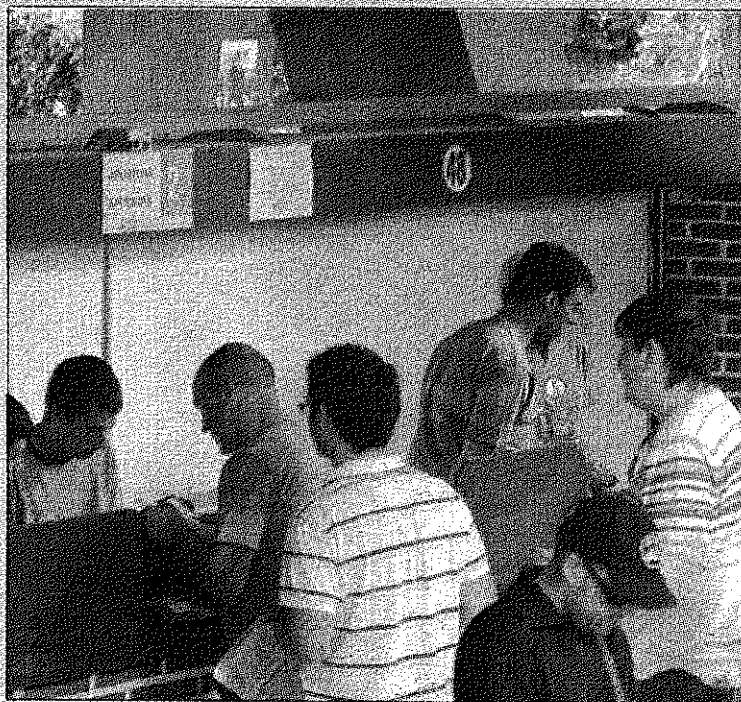
Apostantes acuden a realizar sus pronósticos antes de una carrera

Siguen en oferta 'Landelino' (18.000 euros) 'Afrodita' (2.000 euros) 'Albert Park' (12.000 euros) 'Miss Miriam' (5.000 euros) 'Gran Aguila' (6.000 euros) 'Plateada' (6.000 euros), 'Dannys Dream' (5.000 euros) 'Obama' (4.000 euros) 'Zarzuclera' (5.000 euros) 'La Perita' (5.000 euros) 'Noble Norteño' (15.000 euros) ●